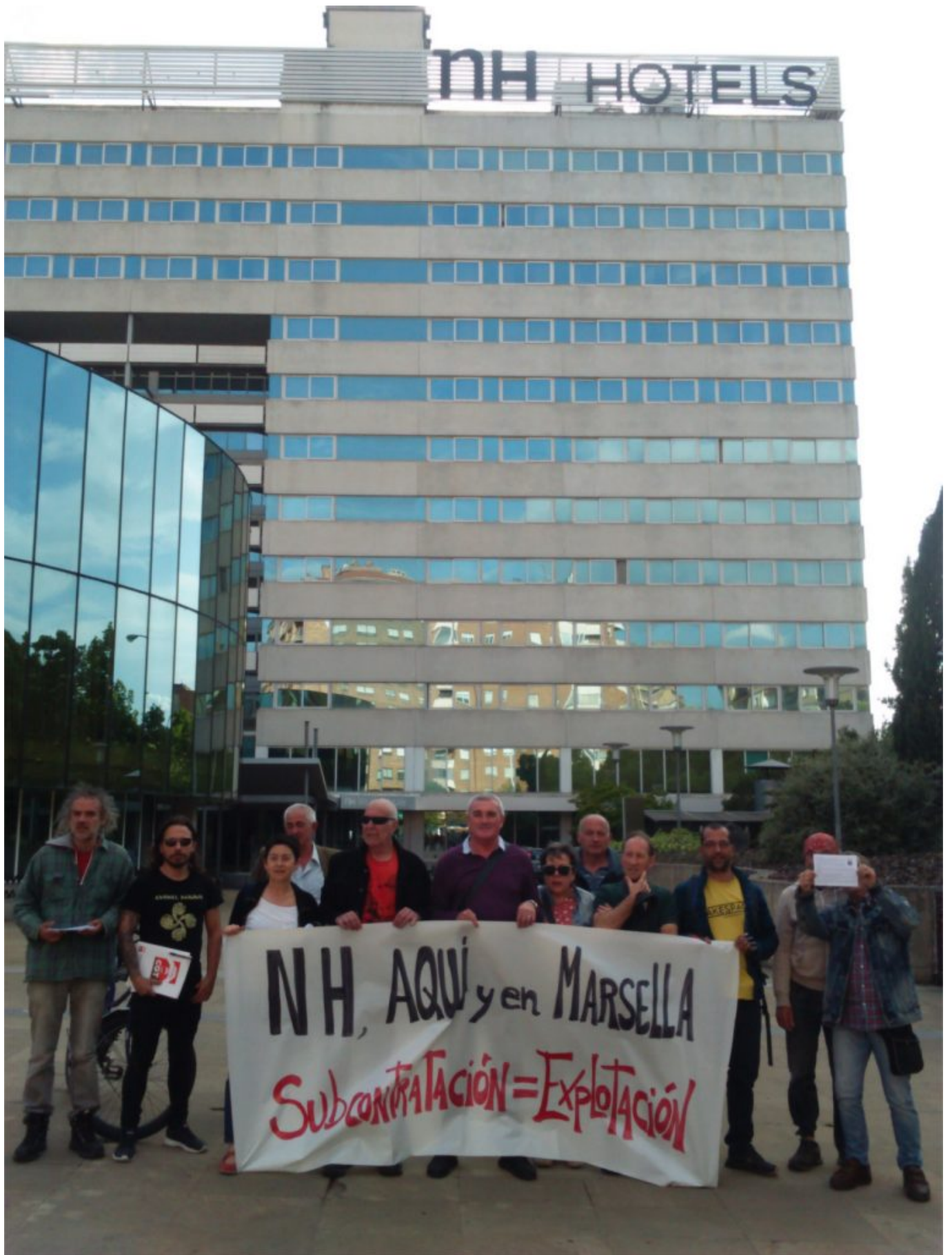
6 de junio, frente al NH Iruña Park